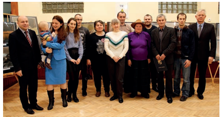
Laureaci XVI edycji Konkursu „Cudze chwalicie, swego nie znacie ...”

Wszystkie prace, zarówno konkursowe jak i wystawowe, można będzie podziwiać od stycznia 2015 r. w budynku Starostwa Powiatowego w Nisku przy ul. 3 Maja 32C.